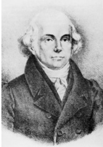
Samuel Hahnemann , de vader van de homeopathie

De term homeopathie is afgeleid van het Griekse homoios (gelijksoortig) en pathos (lijden of ziekte). Homeopathie geldt als een alternatieve geneeswijze . De basisprincipes van de homeopathie werden in de periode 1782-1798 geformuleerd door Samuel Hahnemann [1][2] . De homeopathie maakt soms gebruik van dezelfde grondstoffen als de natuurgeneesmiddelen en de fytotherapie . Het verschil is dat daar gebruik wordt gemaakt van de directe werking van de grondstof, die sterker wordt naarmate de dosis hoger is. Bij homeopathische middelen is de initiële werkzame stof zelf (de oertinctuur ) vrijwel niet meer aanwezig als gevolg van herhaalde verdunning en potentiëring (schudden).